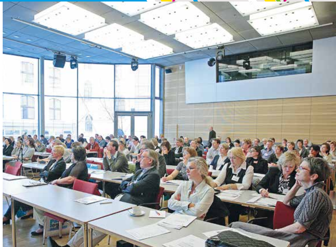
Der Bundesverband ist das Instrument, in dem alle an der Pathologie Beteiligten ihre Kräfte bündeln.