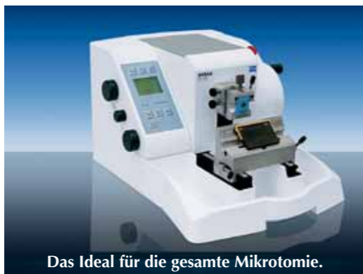
Das Ideal für die gesamte Mikrotomie.