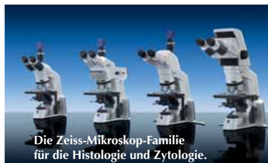
Die Zeiss-Mikroskop-Familie für die Histologie und Zytologie.

Vertrauen Sie auf unsere Fachkompetenz. Wir finden sicher, schnell und unkompliziert die für Sie passende Lösung.